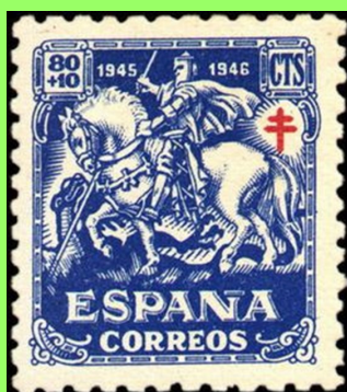
Ingrandimenti del primo e secondo tipo.