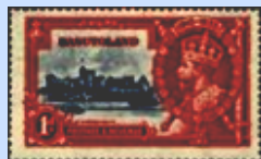
1 p rosso / blu scuro Yv. 11

Va rammentato che il riporto qui l'emissione per il prestigiosissimo Ordine della Basutoland, l'odierno Regno del Giarrettiera, nel Gran Collare, ha il Lesotho - il cui Sovrano, Sua Maestà pendente raffigurante il San Giorgio, Letsie III, è stato nominato dal Nostro tale Collare, indossato anche da Gran Gran Maestro, nel 2013, nella Sacra Giorgio V, nella sua qualità di Gran Milizia Costantiniana con il massimo Maestro dell'Ordine suddetto, figura grado dell'Ordine - il numerino che in molti francobolli emessi in serie di riporto sotto ogni francobollo è tratto 4 francobolli per le varie Colonie dalla catalogazione del Catalogo Britanniche nel 1935, fra i tanti, Yvert & Tellier. essendo con la stessa immagine,