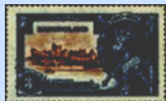
3 p blu violetto / marrone Yv. 13