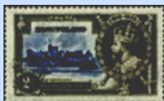
2 p grigio / oltremare Yv. 12