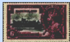
6 p violetto / blu nerastro Yv. 14

Valori : 1 penny + 2 + 3 + 6 penny Tipo di Stampa: Calcografia Formato: Francobolli 44 mm x 28 mm. Perforazione: 13 1/2 x 14 Filigrana: multipla CA